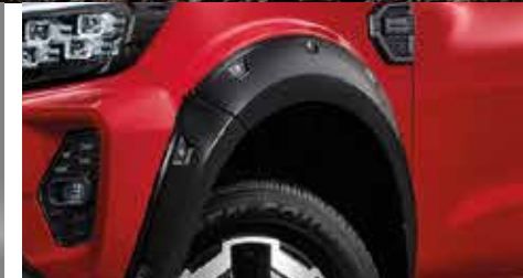
Over Fender ชุดคิ้วซุ้มล้อ