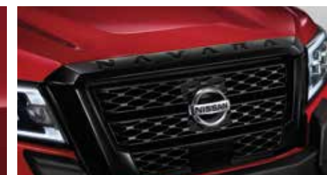
Molding Assy Hood Top (Black Color) โลโก้ฝากระโปรงหน้า (สีดำเทา)