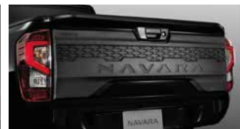
Rear Tail Gate Garnish (KC) ฝาครอบกระบะท้าย ลายคาร์บอน (KC)