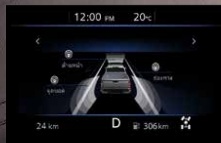
Driving Aids ระบบช่วยในการขับขี่