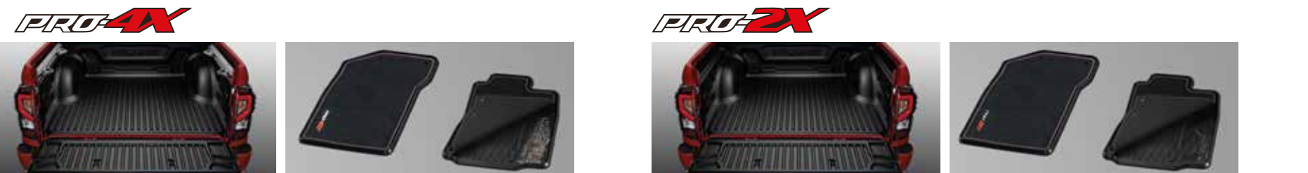
Bed Liner Type C PRO-4X พื้นปูกระบะท้าย แบบ C PRO-4X | Dual Floor Carpet PRO-4X ชุดพรมพร้อมพ้ายางปูพื้น PRO-4X | Bed Liner Type C PRO-2X พื้นปูกระบะท้าย แบบ C PRO-2X | Dual Floor Carpet PRO-2X ชุดพรมพร้อมพ้ายางปูพื้น PRO-2X