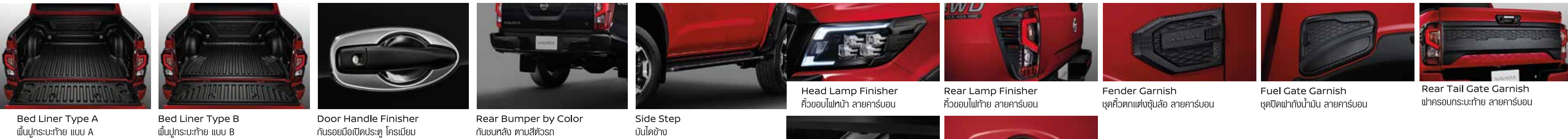
Bed Liner Type A พื้นปูกระบะท้าย แบบ A | Bed Liner Type B พื้นปูกระบะท้าย แบบ B | Door Handle Finisher ก้านรอยมือเปิดประตู โครเมียม | Rear Bumper by Color กั้นชนหลัง ตามสีตัวรถ | Side Step บันไดข้าง | Head Lamp Finisher คิ้วขอบไฟหน้า ลายคาร์บอน | Rear Lamp Finisher คิ้วขอบไฟท้าย ลายคาร์บอน