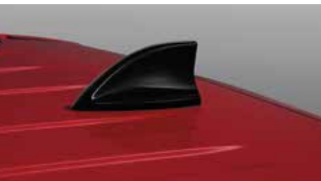
Shark Fin Antenna (Black) เสาอากาศแบบครีบฉลาม (สีดำ)