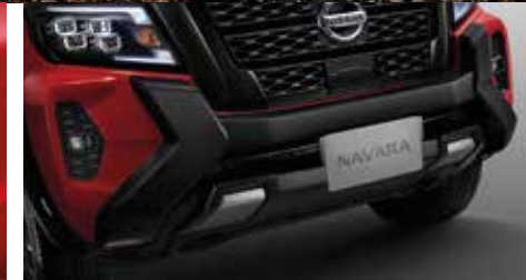
Nudge Bar กันชนหน้าแบบออฟโรด