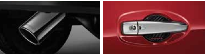
Fender Garnish ชุดคิ้วตกแต่งซุ้มล้อ ลายคาร์บอน | Fuel Gate Garnish ชุดปิดฝาถังน้ำมัน ลายคาร์บอน | Rear Tail Gate Garnish ฝาครอบกระบะท้าย ลายคาร์บอน | Exhaust Pipe Finisher ปลอกปลายท่อไอเสีย | Door Handle Protector ก้านรอยมือเปิดประตู ลายคาร์บอน