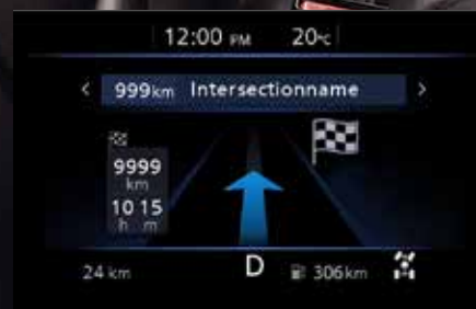
Turn-by-turn Directions ระบบเตือนนำทาง

มาพร้อมระบบการทำงานที่ทำให้คุณกับรถยนต์สื่อสารกันได้เพียงปลายนิ้ว หลากหลายฟังก์ชันการทำงาน เช่น การตรวจสอบประวัติ หรือแสดงพิกัดรถยนต์บนสมาร์ตโฟน ให้คุณมั่นใจตลอดการเดินทาง