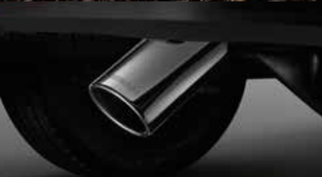
Exhaust Pipe Finisher ปลอกปลายท่อไอเสีย

ปักอัฟองงริยะภาพลักษณ์ใหม่ที่แข็งแกร่ง ออกแบบและทดสอบการลุย เพื่อตอบโจทย์ ทุกไลฟ์สไตล์เสริมความแกร่งด้วยชุดแต่งดีไซด์สุดเข้มข้น แต่งครบจากโรงงาน