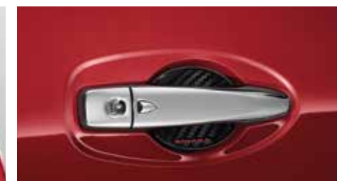
Door Handle Protector กันรอยมือเปิดประตู ลายคาร์บอน