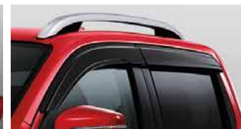
Door Visor คิ้วกันสาดประตู