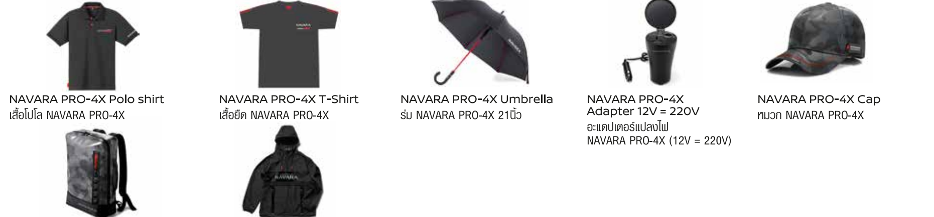
NAVARA PRO-4X Polo shirt เสื้อโปโล NAVARA PRO-4X | NAVARA PRO-4X T-Shirt เสื้อยืด NAVARA PRO-4X | NAVARA PRO-4X Umbrella ร่ม NAVARA PRO-4X 21นิ้ว | NAVARA PRO-4X Adapter 12V = 220V อะแดปเตอร์แปลงไฟ NAVARA PRO-4X (12V = 220V) | NAVARA PRO-4X Cap หมวก NAVARA PRO-4X