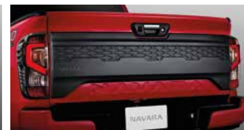
Rear Tail Gate Garnish (DC) ฝาครอบกระบะท้าย ลายคาร์บอน (DC)