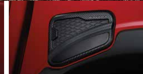
Fuel Gate Garnish (DC) ชุดปิดฝาถังน้ำมัน ลายคาร์บอน (DC)