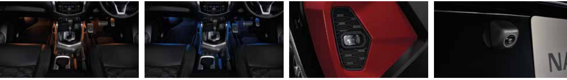
Room Leg Lamp (Amber) ชุดไฟส่องสว่างพื้นรถ (สีส้ม) | Room Leg Lamp (Blue) ชุดไฟส่องสว่างพื้นรถ (สีฟ้า) | Fog Lamp Kit ชุดไฟตัดหมอก | Rear View Camera กล้องมองหลัง