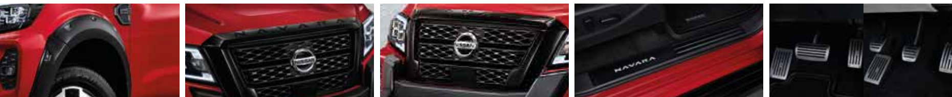
Over Fender ชุดคิ้วซุ้มล้อ | Molding Assy Hood Top (Black Color) โลโก้ฝากระโปรงหน้า (สีดำเงา) | V-Motion Outer Grill (Black Color) กระจังหน้า ตัววี (สีดำเงา) | Kicking Plate ชุดคิ้วบันไดสแตนเลส | Sport Pedal (AT/MT) เป็นวางเท้าแบบสปอร์ต (เกียร์อัตโนมัติ / เกียร์ธรรมดา)