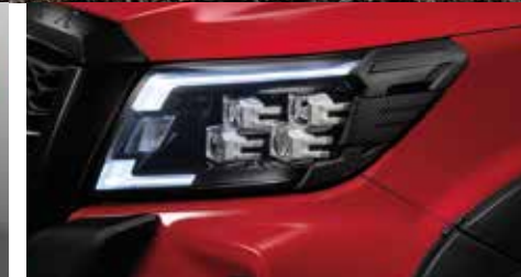
Head Lamp Finisher คิ้วขอบไฟหน้า ลายคาร์บอน