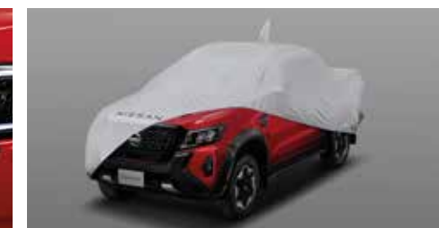
Car Cover ผ้าคลุมรถ