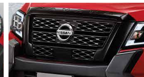
V-Motion Outer Grill (Black Color) กรงข้างหน้า ตัววี (สีดำเทา)