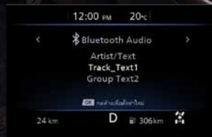
Bluetooth Audio ระบบเสียงผ่านบลูทูธ