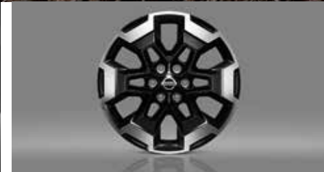
Alloy Wheels (18") ล้อแม็กขอบ 18 นิ้ว