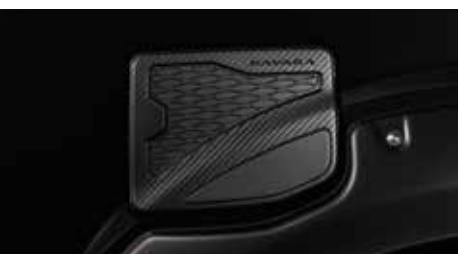
Fuel Gate Garnish (KC) ชุดปิดฝาถังน้ำมัน ลายคาร์บอน (KC)