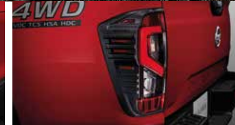
Rear Lamp Finisher คิ้วขอบไฟท้าย ลายคาร์บอน