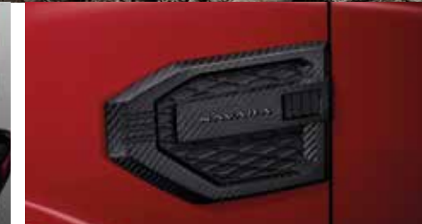
Fender Garnish ชุดคิ้วตกแต่งซุ้มล้อ ลายคาร์บอน