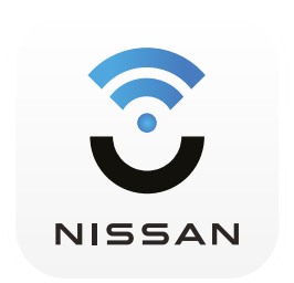
NissanConnect ระบบเชื่อมต่อรถยนต์อัจฉริยะ